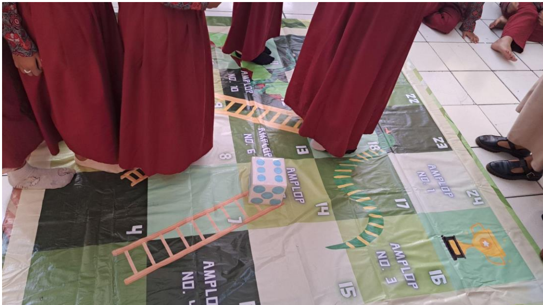
Gambar 1. Implementasi Media Ular Tangga

Sebelum implementasi permainan ular tangga, siswa kelas 4 telah mengembangkan pemahaman mereka tentang fenomena perundungan. Pemahaman ini diperkuat melalui sebuah proyek tentang larangan perundungan yang melibatkan pembuatan karya seperti poster pada dalam kelas. Pada gambar 1 terlihat mereka telah memahami bahwa perundungan memiliki dampak negatif bagi korban dan telah mengetahui bahwa dalam ajaran Islam, perundungan dilarang. Meskipun selama observasi tidak ditemukan kasus perundungan yang serius, beberapa siswa mengaku mengalami perundungan verbal, misalnya dengan mengejek nama orang tua.